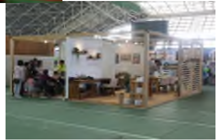
土間ブースイメージ（写真は2ブース）