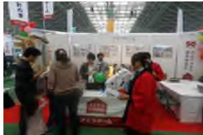
通常ブースイメージ